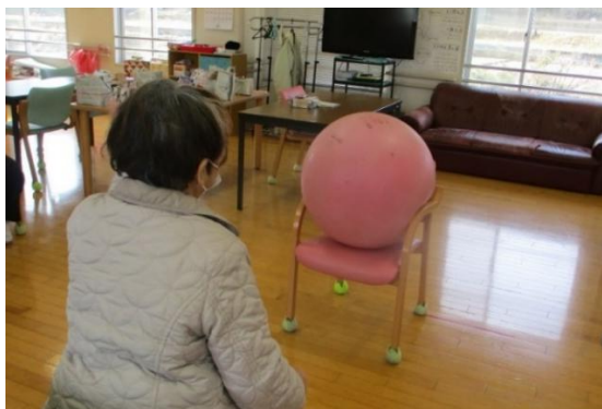
1人ずつ3回チャレンジしてもらいました。

このゲームはボールに向かって投げる肩の運動と跳ね返ってきたおじゃみをキャッチする素早い体の反応を引き出す目的で行いました。