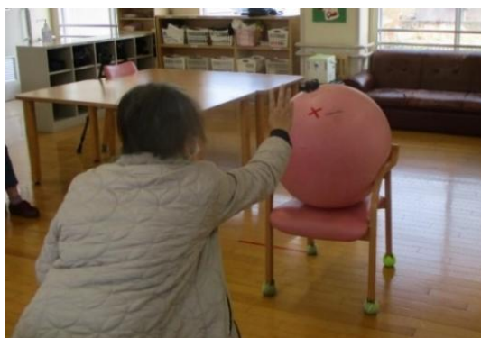
中心に×印をつけて狙いやすくしました。

2つ目は、机に新聞で作った袋に鬼やおたふくの顔を貼って玉投げゲームを行いました。この時はおじゃみではなく綿の玉を使いました。机を少し斜めにしていることで狙った袋以外のところに運よく入る偶然も楽しめるゲームです。