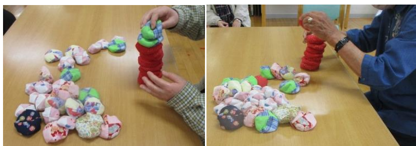
皆さん倒れない様に手でしっかりと抑えながら積み上げておられました。