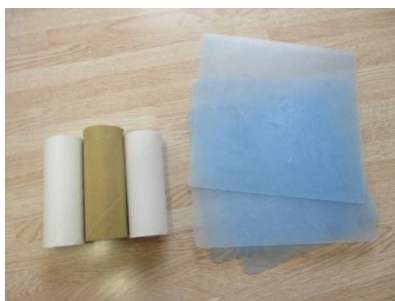
トイレットペーパーとプラスチックの板を使用します。

る所を見つけ、うまく引き抜くのが重要です。手の細かい運動と集中力、観察力が大切なゲームです。今回は10人で行い、3周目で倒してしまうことが多く、1回のゲームは10分程度でした。