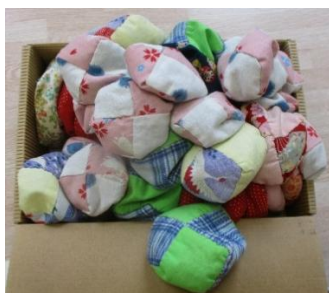
おじゃみは大きさや重さなど少しずつ違います。

このゲームは、バランスよく積み重ねていくので、集中力はもちろん、おじゃみをうまく重ねていくために両手の運動も促すことができます。