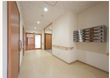
高齢者の方も安心な バリアフリー設計