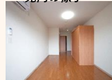
各居室にトイレや エアコンなどを完備